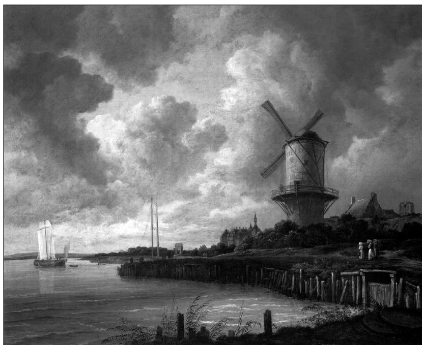
Ilustr. 3. Jacob van Ruisdael, Wiatrak w Wijk koło Duurstede , ok. 1670. Rijksmuseum, Amsterdam, wg J. Huizinga, Kultura XVII- wiecznej Holandii , Kraków 2008, po s. 38