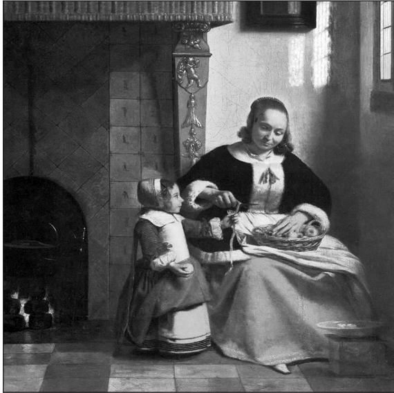
Ilustr. 4. Pieter de Hooch, Kobieta obierająca jabłko (fragment obrazu), ok. 1663. The Wallace Collection, Londyn, wg Von Frans Hals bis Vermeer. Meisterwerke holländischer Genremalerei , Berlin 1984, s. 194