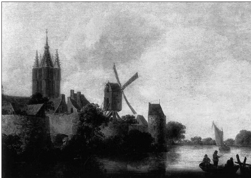
Ilustr. 2. Wouter Knijf, Pejzaż rzeczny z architekturą , k. lat 40. XVII w. Zamek Królewski na Wawelu, wg Winiewicz-Wolska, Malarstwo Holenderskie w zbiorach Zamku Królewskiego na Wawelu , Kraków 2001, s. 119